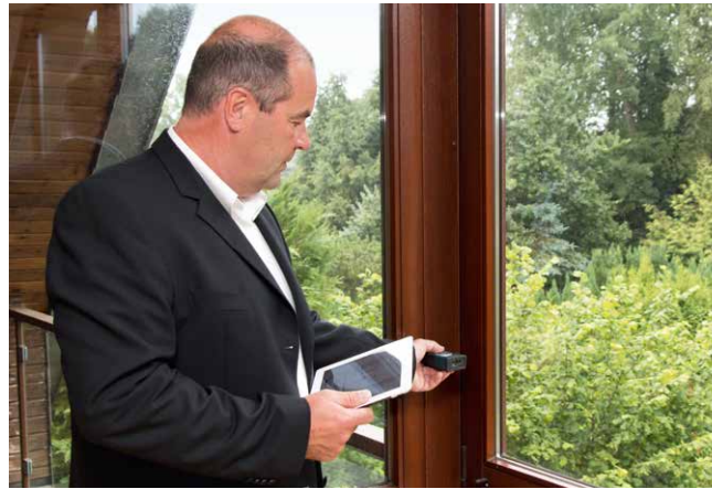
Kontrollmessung der Wohnfläche