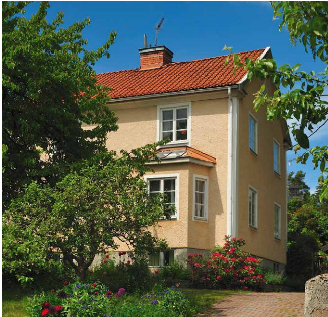
Traumhaus oder Albtraum? Fragen Sie unseren Experten!

Beim Kauf einer gebrauchten Immobilie gilt meist „gekauft wie gesehen“. Gehen Sie deshalb auf Nummer sicher mit der unabhängigen Sparda Käuferberatung.