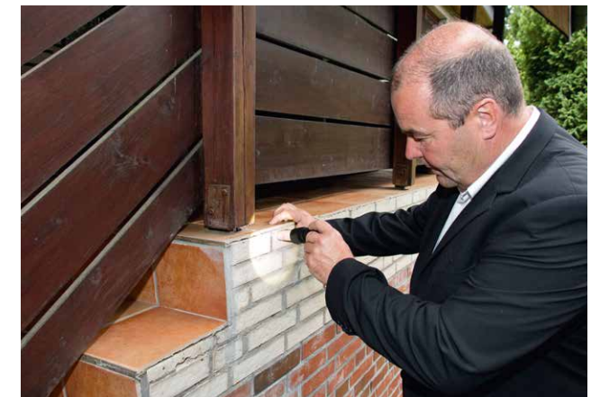
Feuchtigkeitsschäden am Außenaufgang?

Jetzt Sparda Käuferberatung kennenlernen: Telefon 040.35 74 01-2066, info@spardaimmobilien.de