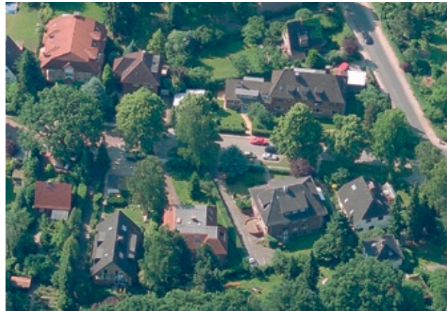
Von Luftbild bis 3D-Besichtigung – Ihre Immobilie aus jeder Perspektive