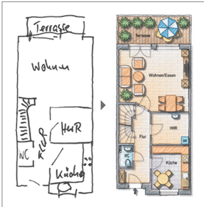
Von der Handskizze zum attraktiven Grundriss

Entdecken Sie jetzt den ersten Coach für Ihre Immobilie: unabhängig, kompetent, erfahren- und viel preisgünstiger, als Sie denken!