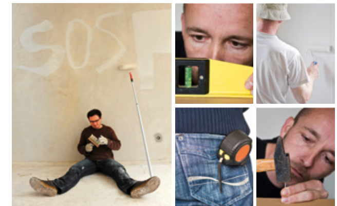
Der HausCoach hilft: messen, prüfen, realisieren

Telefon 040.35 74 01-2066, info@spardaimmobilien.de