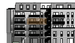
Hofansicht von Süden