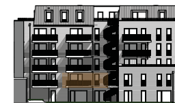
Hofansicht von Süden