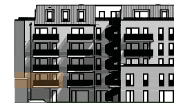
Hofansicht von Süden